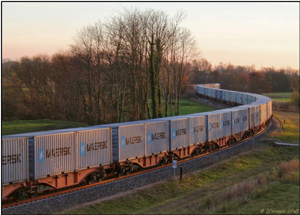
Unterwegs in Richtung Österreich in der untergehenden Sonne im Bereich der Ölweiche.